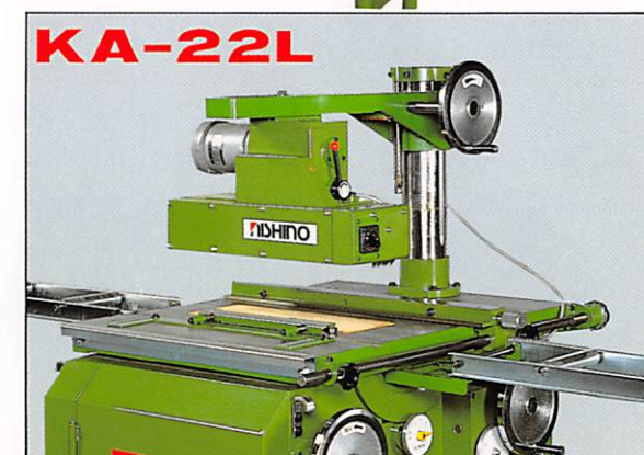
KA-22L Lタイプ(ロングアーム・フトコロ 375~450mm仕様)