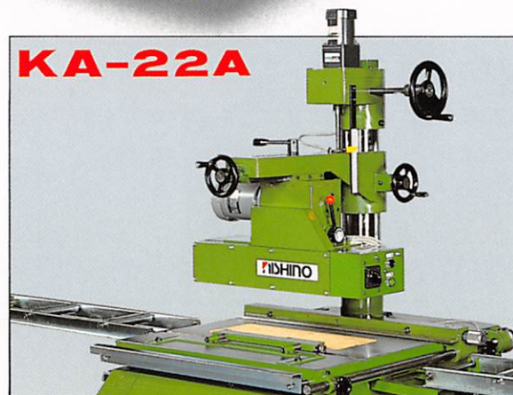
KA-22A Aタイプ(送り機自動昇降仕様)