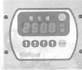
デジタル表示装置 (オプション仕様)