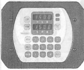
プリセット装置(オプション) 自動定盤の自動位置決め機能