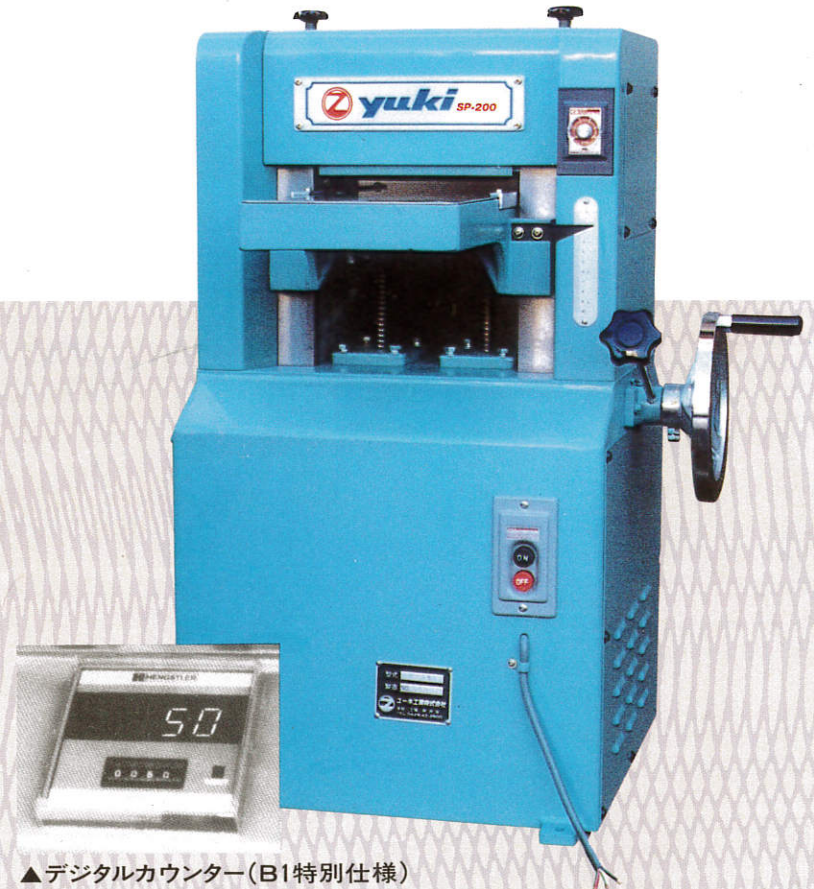
▲デジタルカウンター(B1特別仕様)

組子・薄板・プラスチック・エンビ加工に最適。 最高の技術が保証する、省力化、無騒音。