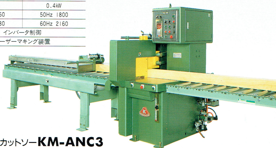
87 フルオートクロスカットソー KM-ANC3