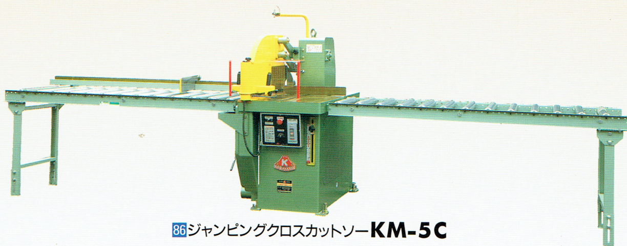
86 ジャンピングクロスカットソー KM-5C