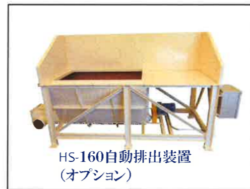
HS-160自動排出装置 (オプション)