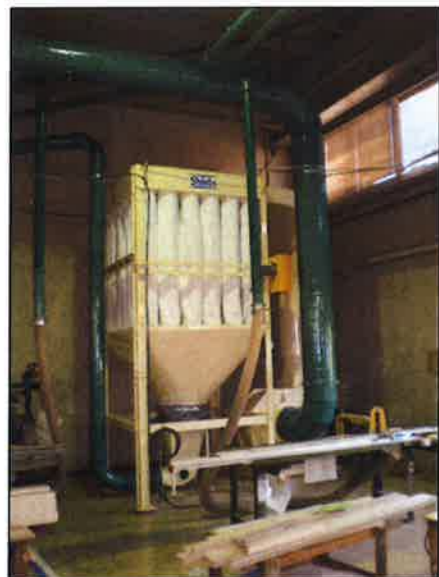
KBF-11 送りホッパー付(オプション)